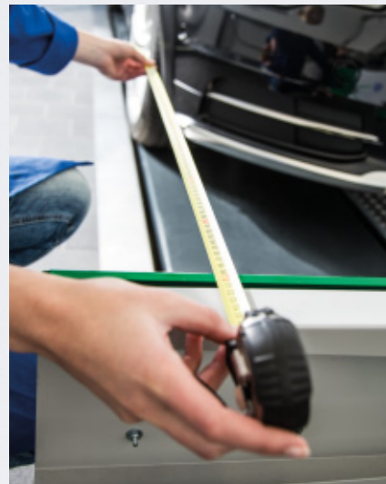
Kalibrierung in wenigen Schritten***