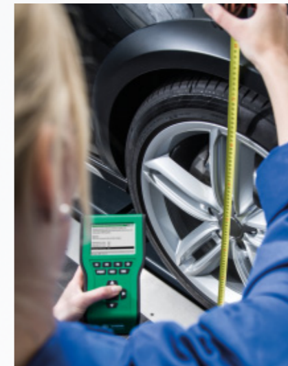
Höhenstandswerte der einzelnen Räder abmessen